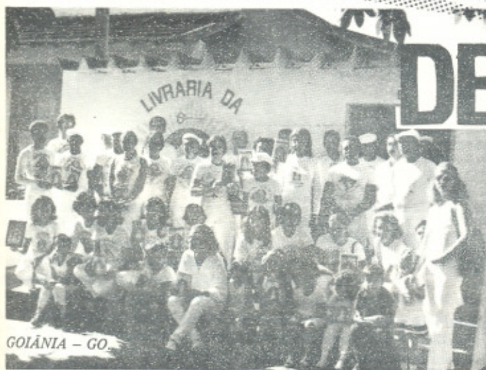
GOLÂNIA - GO.