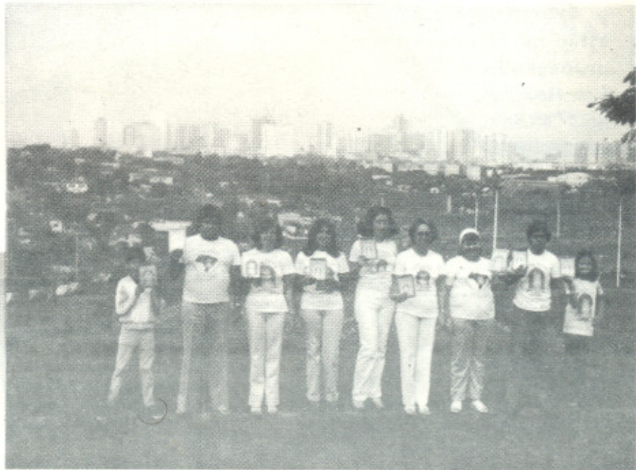
Em Londrina – Paraná, estudantes de "CULTURA RACIONAL".

POR INTERMÉDIO DO LIVRO DELES, ENTREI EM CONTACTO COM ELES, E TIVE SOLUÇÃO IMEDIATA. QUAL É O LIVRO? UNIVERSO EM DESENCANTO, CONHECIMENTO DE CULTURA EXTRACÓSMICA RACIONAL.