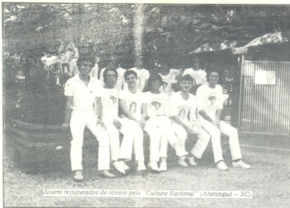
Jovens recuperados de tóxico pela "Cultura Racional" (Araranguá - SC).

EU, COMO TODO MUNDO, SEMPRE PROCUREI A VERDADE EM MUITOS LUGARES, NOS CONHECIMENTOS TERRENOS DAS MAIS DIFERENTES CATEGORIAS, E DURANTE UM BOM TEMPO, QUANDO ME APARECEU O TÓXICO, TORNEI-ME UM DE SEUS CONSUMIDORES, NA ÂNSIA DE AMPLIAR MINHA MENTE.