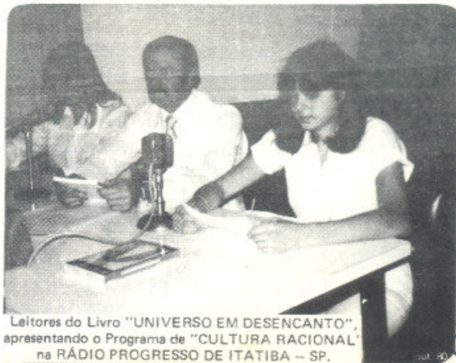
Leitores do Livro "UNIVERSO EM DESENCANTO", apresentando o Programa de "CULTURA RACIONAL" na RÁDIO PROGRESSO DE ITATIBA – SP.