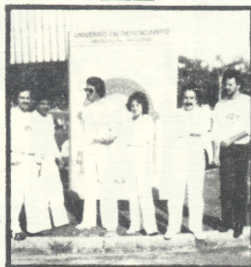
Estudantes de CULTURA RACIONAL em São Paulo, divulgando o Livro UNIVERSO EM DESENCANTO .