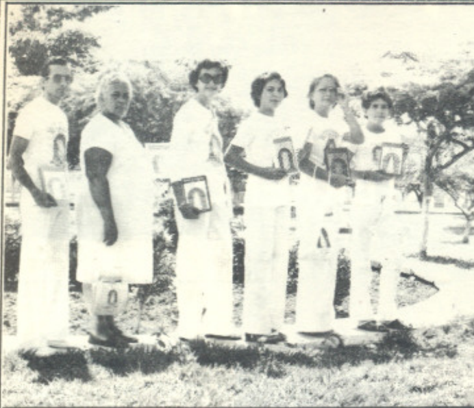
Leitores e divulgadores em Sergipe