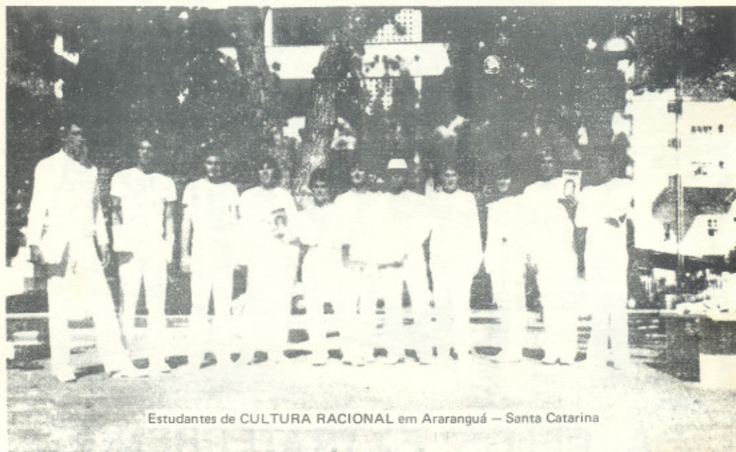
Estudantes de CULTURA RACIONAL em Araranguá — Santa Catarina