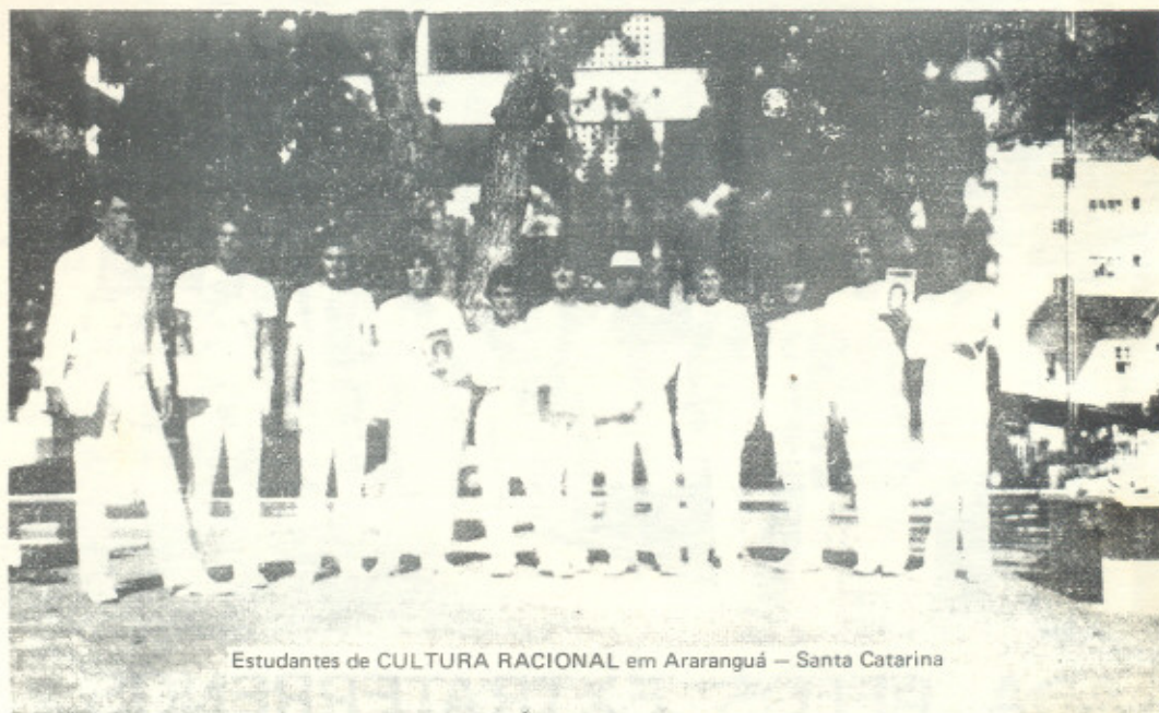
Estudantes de CULTURA RACIONAL em Araranguá — Santa Catarina