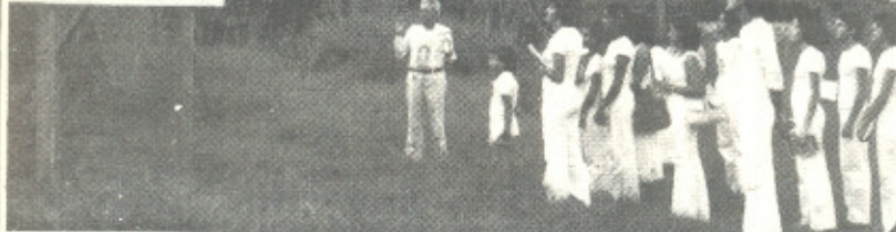
ESTUDANTES DE CULTURA RACIONAL EM GOIÂNIA - GO

ONDE ESTÁ A DIVINA PROVIDÊNCIA DO MUNDO RACIONAL ESTÁ A FORÇA SUPREMA PROVIDENCIANDO A SOLUÇÃO DOS DESAJUSTES FÍSICOS, MORAIS, MENTAIS OU FINANCEIROS. E A DIVINA PROVIDÊNCIA É O CONHECIMENTO DE REDENÇÃO ETERNA DADO PELO VERDADEIRO DEUS, O RACIONAL SUPERIOR, NOS LIVROS UNIVERSO EM DESENCANTO