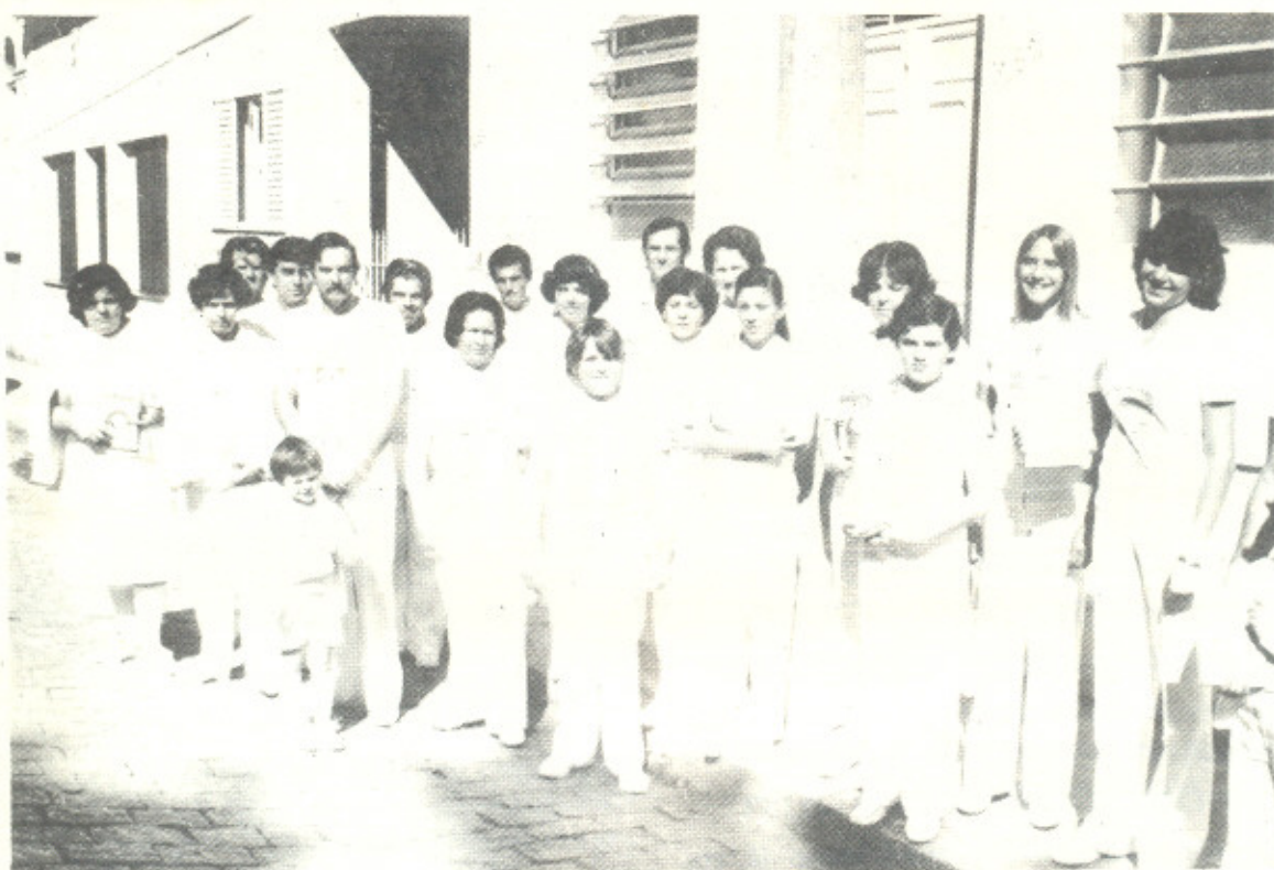
Estudantes de CULTURA RACIONAL em Itatiba – SP

O desejo de encontrar a solução para os problemas que me afligiam, levou-me à frequentar diversos meios, dentre eles os centros espíritas.