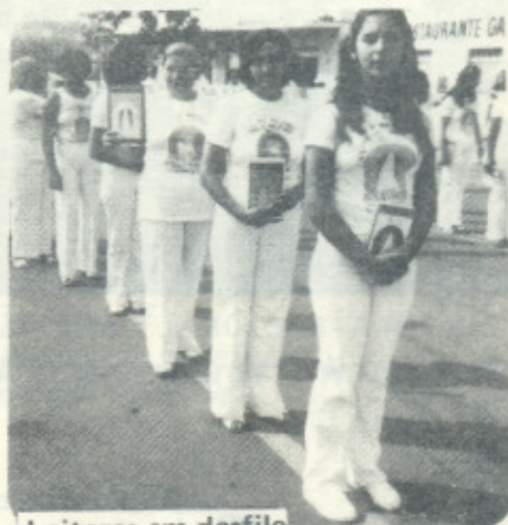
Leitores em desfile

Agora estamos em plena FASE RACIONAL, a fase natural da natureza e a áurea de todos é Racional, para o desenvolvimento do raciocínio e encontrar o equilíbrio perdido. E dessa forma, o mundo passou para última fase da vida da matéria, por ser a fase da volta de toda a humanidade para o seu Mundo de Origem, o MUNDO RACIONAL.