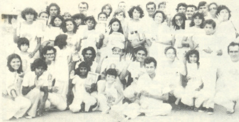
GRUPO DE LEITORES EM FORTALEZA - CE

O CORPO DE ENERGIA RACIONAL, É A IDENTIDADE RACIONAL. A CAUSA DOS VÍRUS EXISTENTES NO PINGO D'ÁGUA QUE DERAM O NOME DE SÊMEN, QUE SE TRANSFORMA ESSE PINGO D'ÁGUA EM UMA MÁQUINA HUMANA. É O QUE IDENTIFICA A ORIGEM DE SEREM DE ORIGEM RACIONAL. ESSE CORPO DE ENERGIA RACIONAL QUE É A IDENTIDADE DO MUNDO RACIONAL É QUE VOLTA PARA O MUNDO RACIONAL E DAÍ A PESSOA NÃO NASCENDO MAIS AQUI NESSE MUNDO POR A CAUSA DE SUA EXISTÊNCIA AQUI, VOLTAR AO SEU VERDADEIRO MUNDO DE ORIGEM, O MUNDO RACIONAL. SABERÃO COMO SÃO FEITOS TODOS ESSES MOVIMENTOS, ESSA TRASLADAÇÃO E ESSA MUDANÇA NOS LIVROS DE "CULTURA RACIONAL", DO "RACIONAL SUPERIOR".