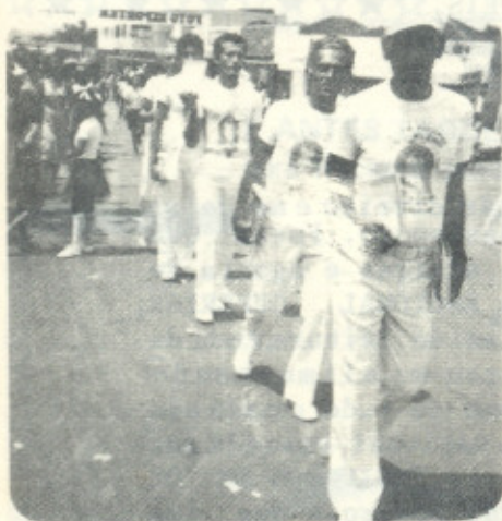
grupo de leitores de CULTURA RACIONAL em desfile