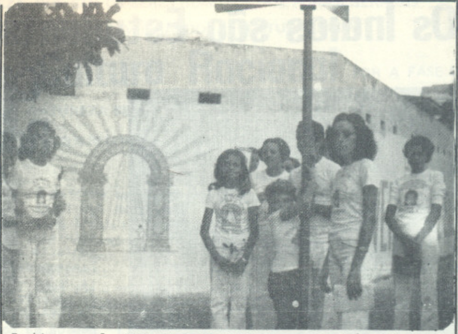
Leitores de CULTURA RACIONAL, em Goiás, diante de um mural, divulgando a Fase Racional.

D eixei para sempre a auto-destruição por ter encontrado o verdadeiro significado da vida e ver que meus Irmãos do MUNDO RACIONAL já estão há muito aqui na Terra, sendo chamados pelos leigos da Verdades das Verdades como discos voadores. Agora sabendo como entrar em diálogo com Eles através da Energia Racional, ocupo-me o máximo que posso no desenvolvimento do meu Raciocínio, o vínculo de ligação à Superioridade Racional, e na recuperação de outros infelizes como eu era.