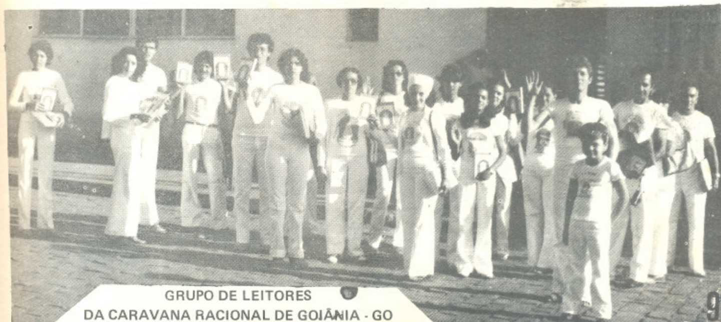
GRUPO DE LEITORES DA CARAVANA RACIONAL DE GOIÂNIA - GO