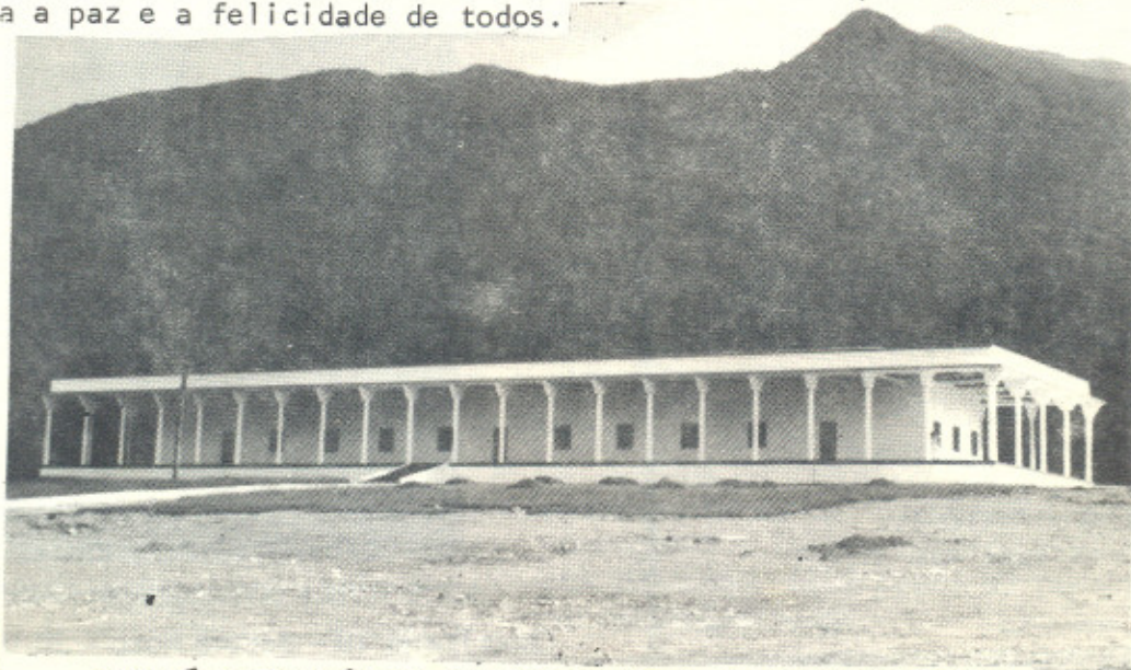
ESTA É A RESIDÊNCIA DOS HABITANTES DO MUNDO RACIONAL. É O PRIMEIRO MARCO SIMBÓLICO DA FASE RACIONAL-A FASE DO 3º MILENÁRIO.

que é a CULTURA RACIONAL, é que pode endireitar o que é Racional para a paz e a felicidade de todos.