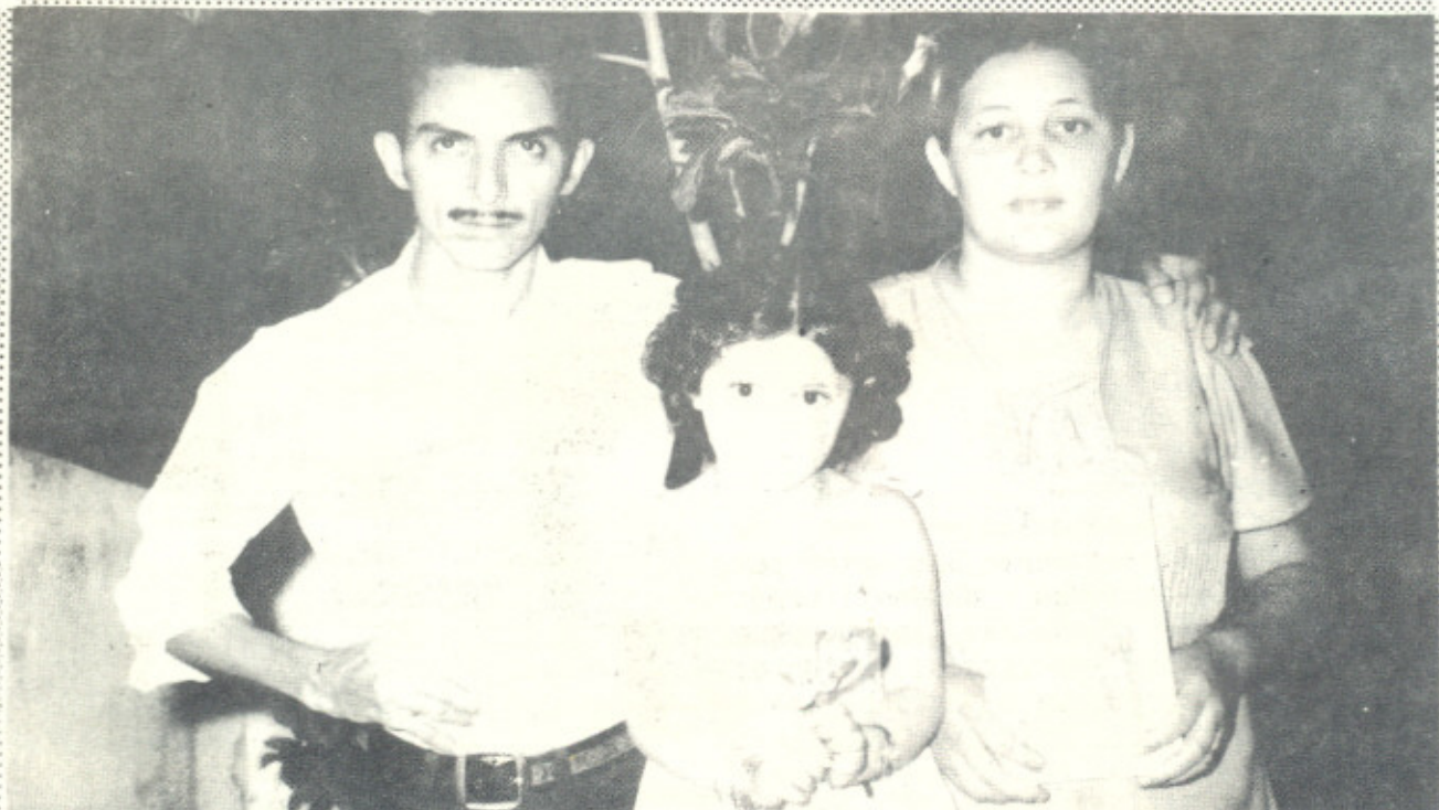
Hoje a família Barreto Freire vive feliz.

E ra muito doente dos nervos e tinha a mania de recorrer aos médicos para tudo. Muitas vezes fui a dois médicos num só dia. Tornei-me sócio de uma clínica perto do meu trabalho e lá ia eu para auscultar o coração, o pulmão e por aí a fora. Fiz amizade com muitos médicos e já entrava nos consultórios sem marcar entrevistas. Eram consultas tão frequentes que mesmo os funcionários penalizavam-se de mim. Minha esposa sofria comigo. Até que começamos a ler o Livro UNIVERSO EM DESENCANTO e nunca mais precisei de médicos. Ainda voltei aquela clínica mas não para tratar de assunto de doença e sim para divulgar o Livro UNIVERSO EM DESENCANTO. A leitura curou-me completamente de todos os males e hoje convictos da Verdade das verdades, minha esposa e eu saímos batendo de porta em porta divulgando a Cultura que nos conduziu a uma vida plena de saúde e felicidades Racionais. Felicidades Verdadeiras porque Racional não alimenta aparências.