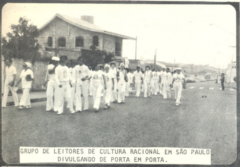
GRUPO DE LEITORES DE CULTURA RACIONAL EM SÃO PAULO DIVULGANDO DE PORTA EM PORTA.

A BEBIDA ALCÓOLICA ESTAVA ARRASTANDO MEU MARIDO E NÓS QUE LHE ESTAMOS LIGADOS, À LIQUIDAÇÃO FÍSICA, MORAL E FINANCEIRA. A ENERGIA RACIONAL O RECUPEROU.