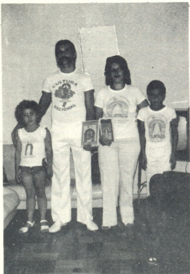
Uma família Racional

E m consequência de problemas psíquicos, meu marido estava completamente desequilibrado e eu fiquei muito doente dos nervos, não tendo sossego nem para dormir, preocupada com a nossa segurança, principalmente das crianças. Temia que ele as machucasse, pois certa noite acordei sufocada com ele me enforcando. Vivia receiosa, tomando precauções para proteger nossos filhos e com isso, emagrecia dia a dia. Contraí uma úlcera nervosa e como não encontrava solução na medicina, recorri aos centros espíritas. A situação piorou de tal forma que julguei meu marido louco e notando que ele forçava a nossa separação, afastei-me com as crianças. Mas sempre voltava por causa delas e dele, este martírio se repetindo por três vezes.