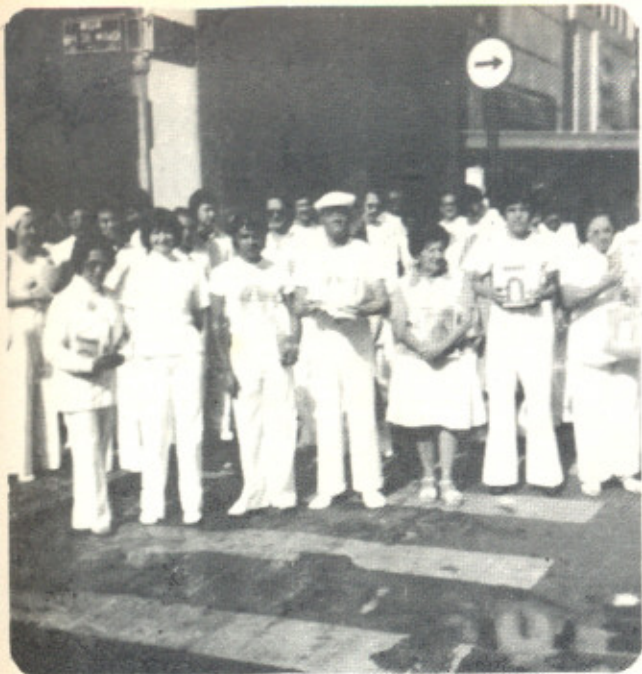
Parte dos Caravaneiros de São Paulo -SP