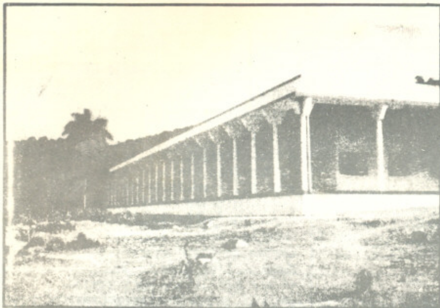
CASA DOS TRES PODERES