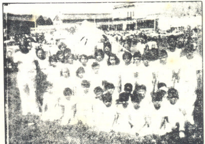
CARAVANA RACIONAL DE MANAUS